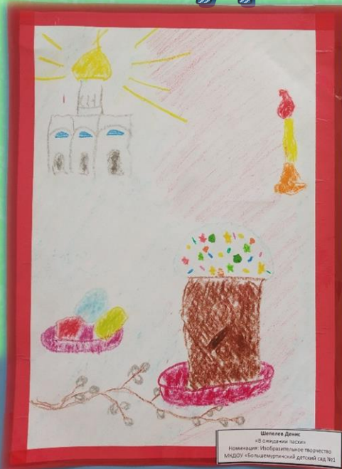
Шеняева Данил «8 ожиданий пасхи» Номинация: Изобразительное творчество МДОУ «Большечуртунский детский сад №1»