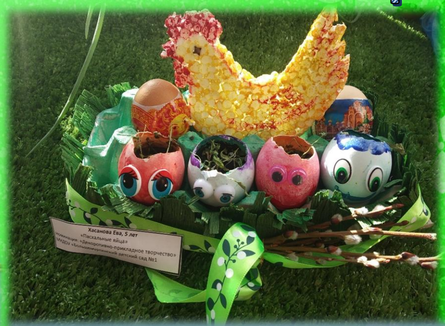
Хасанова Ева, 5 лет «Пасхальные яйца» Номинация: «Декоративно-прикладное творчество» МДОУ «Большечуртунский детский сад №1»