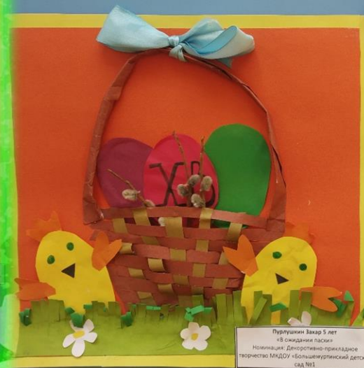
Пурлушкин Захар 5 лет «8 ожиданий пасхи» Номинация: Декоративно-прикладное творчество МДОУ «Большечуртунский детский сад №1»